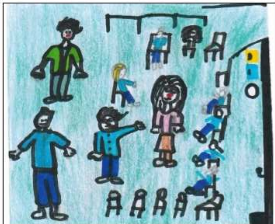
Saynètes à l'école Notre-Dame des Champs

Et pour clôturer la visite, nous avons reçu une gourde très pratique et des bonbons à la menthe.