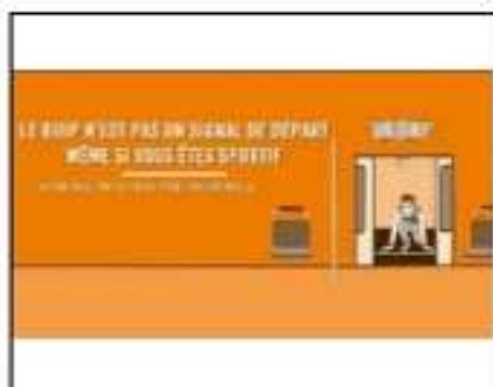
Le signal sonore avertit du danger !

Nous retiendrons de ce projet une super expérience grâce à laquelle on a beaucoup appris !