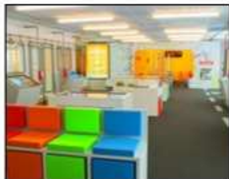
LE centre de la STIB (mobisquare).

Nous avons pu voir les anciens trams principalement mais aussi des vieux bus et les voitures qui apportaient assistance en cas de