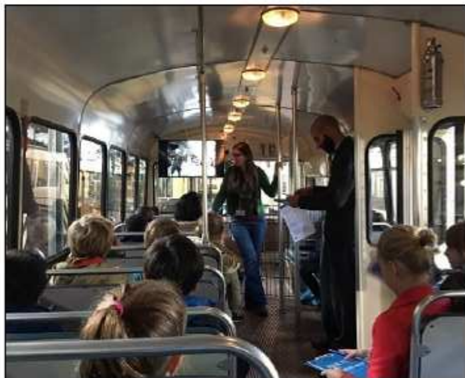
La 5ème D au coeur d'un ancien bus.